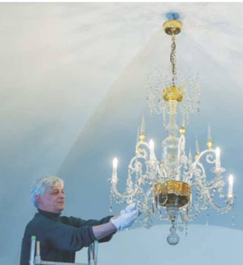
Barokní lustr by se měl stát v muzeu jedním z páteřních exponátů nové expozice barokního umění, která vznikne v rámci velké rekonstrukce muzea. Lustr by se měl stát v muzeu jedním z páteřních exponátů nové expozice barokního umění, která vznikne v rámci velké rekonstrukce muzea.