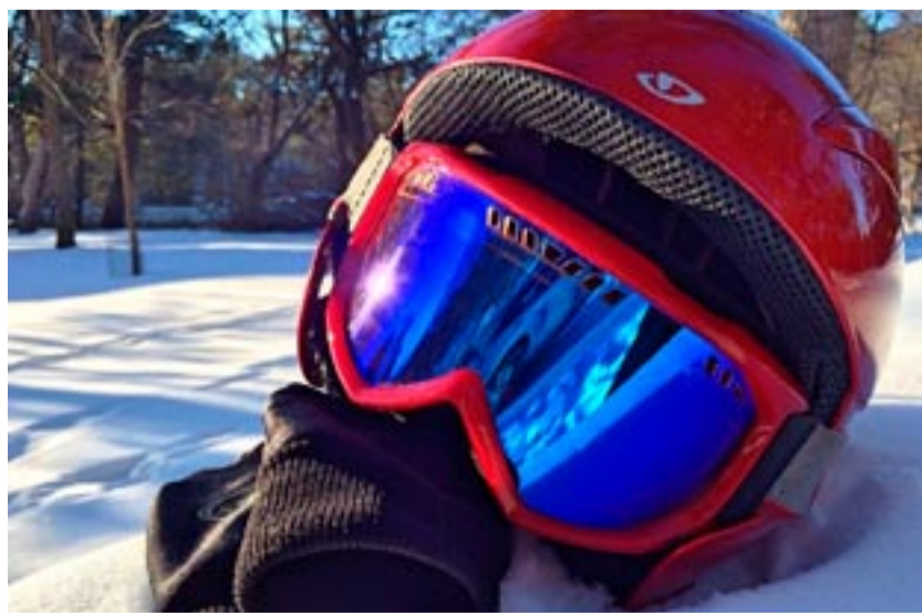
Bezpečnostní přilba je nezbytná i při sáňování. Nesluší, ale při kolizi pomůže.

Zakupit je bude možné od 1. března v sítích Ticketpro nebo na pokladně Home Credit Areny. Část výtěžku poputuje na pomoc útluku Azyl pes v Krásném Lese na Liberecku.